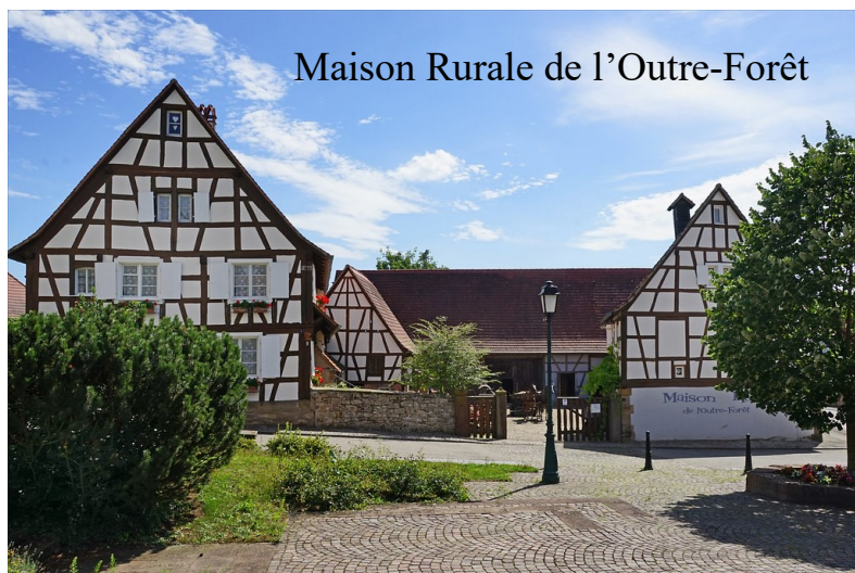
Maison Rurale de l'Outre-Forêt