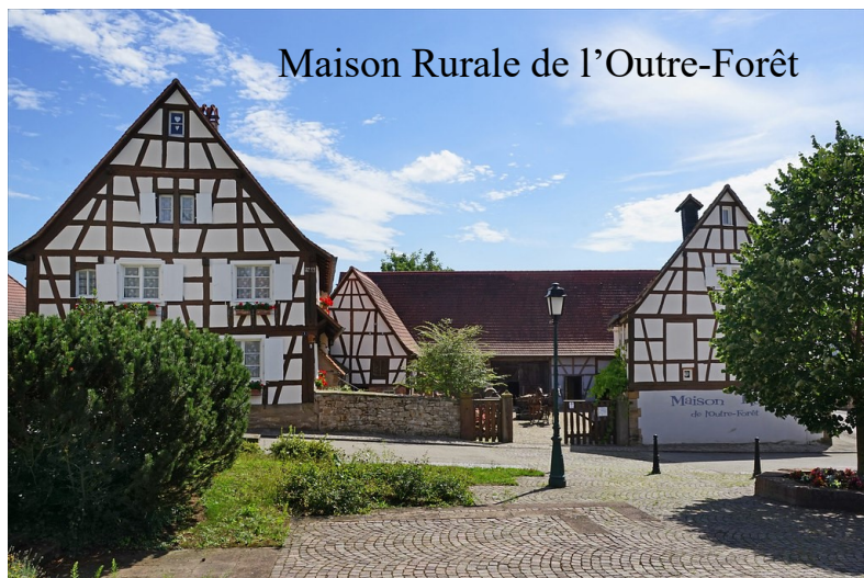
Maison Rurale de l'Outre-Forêt